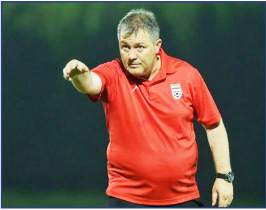
طرح نو؛ مریم دالائی قدیم

دراگان اسکوچیچ رفت؛ بی سروصدا، بی حاشیه، اما با کارنامه‌ای پر از افتخار و قلب‌هایی که هنوز نامش را فریاد می‌زنند. مردی که شاید حضورش روی نیمکت تراکتور کوتاه بود، اما اثرش عمیق و ماندگار شد؛ آن قدر که امروز خداحافظی‌اش برای هواداران، بیشتر شبیه یک دل‌تنگی زودهنگام است تا یک جدایی ساده.