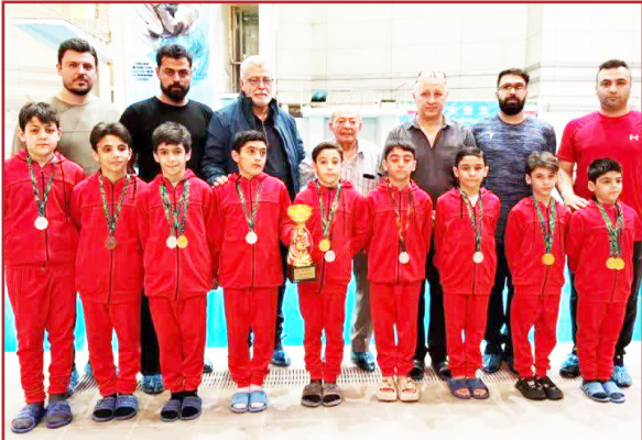
نتیجه تیمی آذربایجان شرقی - مقام اول