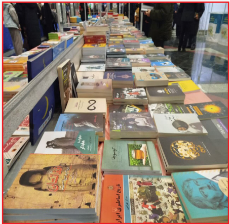
سیاسی عرضه شده و علاقه‌مندان می‌توانند از ساعت ۹ تا ۱۳ و ۱۶ تا ۲۱ از آن بازدید کنند.

فضایی برای بروز آثار دیگران ایجاد می‌کند. همچنین محلی برای تبادل نظر ناشران است. رییس بنیاد ایرانشناسی آذربایجان غربی تصریح کرد: حضور برخی نویسندگان در نمایشگاه، به‌ویژه برای جوانانی که به نویسندگی علاقه دارند، مسیر یادگیری و پیشرفت را هموار می‌کند. وی با اشاره به شعار این نمایشگاه با عنوان «برای ایرانم بخوانیم»، گفت: این شعار باعث جذب جمعیت زیادی از علاقه‌مندان به مطالعه شده و فروش آثار ناشران و نویسندگان را چند برابر می‌کند که در حقیقت حمایت از این قشر فرهیخته به شمار می‌رود. ملکی ادامه داد: برگزاری نمایشگاه فرصتی برای دیده شدن نویسندگان و ناشران نوپا فراهم کرده و کارگاه‌ها و نشست‌های تخصصی با حضور اساتید مجرب به