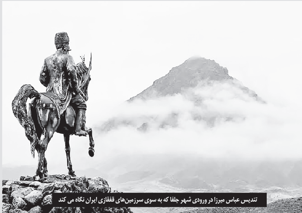
تندیس عباس میرزا در ورودی شهر جلفا که به سوی سرزمین‌های قفقاز ایران نگاه می‌کند