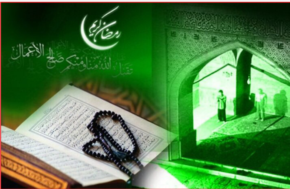
مشارکت اقشار متنوع را فراهم سازد.

راه‌اندازی کاروان «نسیم سحر» در محلات کمتر برخوردار شامل اجرای سحرخوانی سنتی با گروه‌های آیینی و توزیع بسته‌های فرهنگی، برگزاری محفل بزرگ «قرآن و شهر» در پارک جنگلی و محلات مختلف، برگزاری مسابقات، جشنواره‌ها و طرح‌های روزه اولی از جمله برنامه‌های معنوی مذهبی بخشی از برنامه‌های ماه رمضان امسال با رویکرد محله‌محوری است.