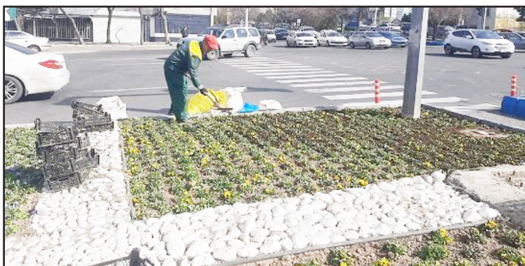
طرح نو؛ گروه شهری مدیرعامل سازمان سیما، منظر و فضای سبز

شهرداری تبریز از آغاز گسترده عملیات خرید و کاشت گل بنفشه در سطح شهر خبر داد و گفت: