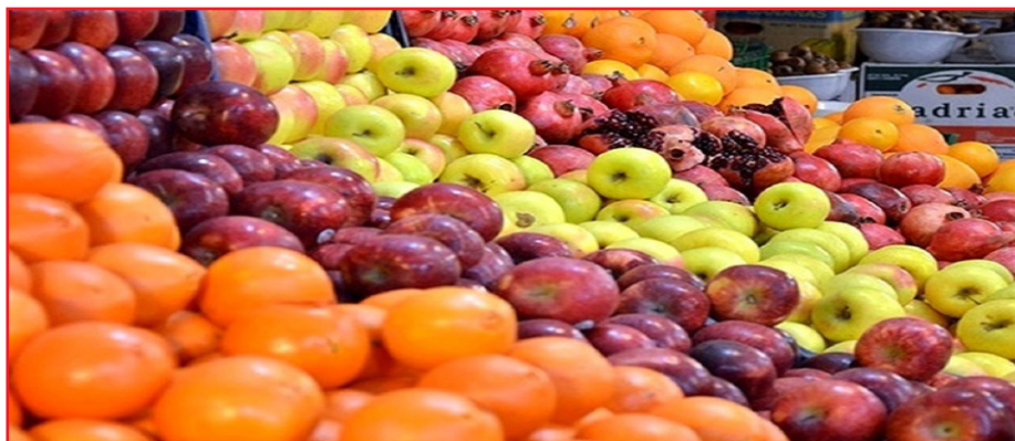
و علاوه بر آن ۱۵ تن نیز از ذخایر احتیاطی کشور برای این منظور پیش‌بینی کرده‌ایم.

مدیر تعاون روستایی با اعلام اینکه این میوه‌ها از حدود ۲۵ ام اسفندماه در بین مردم می‌شود گفت: قیمت میوه‌های ذخیره‌سازی شده ۲ تا ۳ روز قبل از توزیع توسط کمیته کشف قیمت ۱۵ تا ۲۰ درصد پایین‌تر از قیمت خرده‌فروشی بازار تعیین و به مردم عرضه می‌شود.