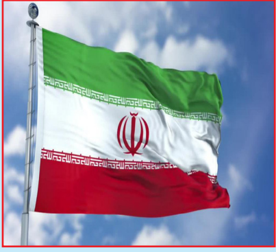
وطنم، ایران عزیز، پاینده باشی و جاویدان، پرچم سرافرازیت همیشه بر فراز این خاک بلند و فروزان باد.

هر وجب از خاک تو، گنجینه‌ای است از فرهنگ غنی، هنر ناب، و دانشی که سینه به سینه منتقل شده است، و هر کوی و برزتش، داستانی شنیدنی از گذشتگان و حال دارد؛ از معماری‌های شگفت‌انگیز گرفته تا نواهای دلنشین موسیقی، و طعم بی‌نظیر غذاهای سنتی‌ات.