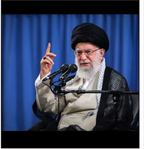
طرح نو؛ سردبیر

در روزی که امت اسلام در ماتم فقدانِ امام خامنه‌ای نشسته است، از هر گوشه این سرزمین، ناله‌هایی برخاسته که نه از اندوه یک رحلت ساده، بلکه از هراسِ خلأ نوری است که بیش از چهار دهه راه را روشن کرده بود. او نه فقط رهبر انقلاب که معلم ایمان، صبر و اندیشه بود؛ صدایی که بیداری را به قرن‌ها خواب‌رفتگی مسلمانان هدیه داد. امام خامنه‌ای را نمی‌توان تنها با عنوان «رهبر جمهوری اسلامی ایران» شناخت. او منظومه‌ای از معنا بود؛ ترکیب کم‌نظیری از علم و سیاست، عرفان و عمل، حلم و قاطعیت. در روزگاری که سیاست در جهان اسلام به معامله و ترس فروکاسته بود، او ایستاد؛ ثابت کرد که قدرت می‌تواند با ایمان پیوند بخورد، که تدبیر سیاسی می‌تواند سرچشمه‌اش از قرآن باشد، نه از منطق هراس و سازش. هر تصمیمش در طول این سال‌ها، از جنگ تا تحریم، از وحدت امت تا مقابله با آشوب فرهنگی، بر محور همان اندیشه‌ای بود که می‌گفت «انسان مؤمن هرگز اسیر شرایط نمی‌شود». این باور، ستون انقلاب را استوار نگه داشت در برابر طوفان‌هایی که امپراتوری‌های خبری و اقتصادی علیه