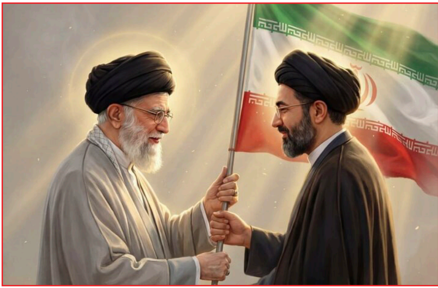
دید: آتشی که از شعله‌ی اول، سرچشمه گرفته و اکنون، با شور و امیدی تازه، قصد جان گرفتن دارد.

احساس مسئولیت، چنان رودخانه‌ای خروشان، در رگ‌هایش جاری است و عطر وظیفه‌شناسی، در وجودش خانه کرده است. او، حامل امانتی سنگین و مقدس است؛ امانتی که از دست پدر، به دستان او سپرده شده است؛ میراثی که روح ملت در آن دمیده شده و امید فردایی روشن را در خود دارد.