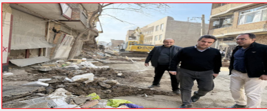
در کشور ارزیابی ها ادامه دارد تا مردم اطمینان حاصل کنند نیروها به صورت میدانی در صحنه حضور دارند.

مسکن از روز اول جنگ تحمیلی افزود: کارشناسان و ارزیابان با فعالیت دو شیفتی در قالب گروه های مشخص تا ۱۷ اسفند توانسته اند سه هزار و ۷۰۰ واحد مسکونی و تجاری آسیب دیده شناسایی و ارزیابی کنند و آنها را با شاخص تخریبی و احداثی، تعمیر، معیشتی و لوازم خانگی بررسی و ثبت کنند.