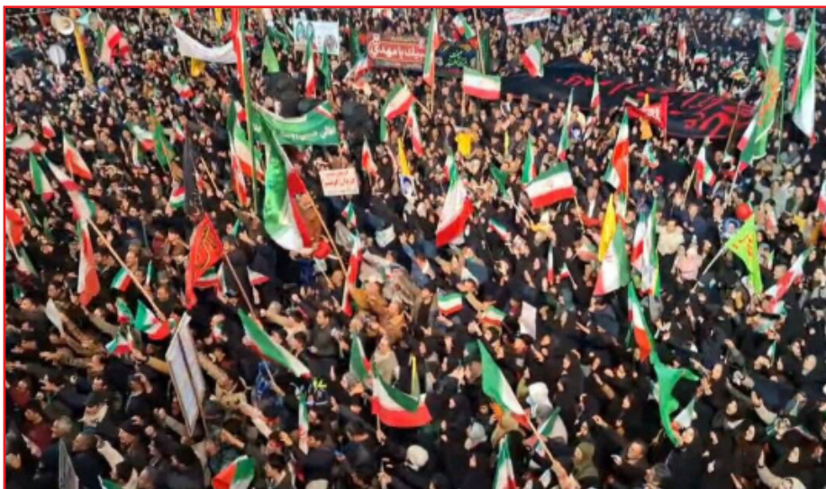
ارمنی‌ها و آشوری‌ها در این شب‌ها، دست‌های خود را به دست هم داده‌اند تا سنگر خیابان را با قدرت در مقابل دشمنان ایران حفظ کنند. اما مردم شجاع ایران با وجود تهدیدهای دشمن، هربش در

طرح نو؛ گروه گزارش شب‌های جنگ تحمیلی آمریکایی - صهیونیستی در ارومیه به صحنه اتحاد مردم این شهر زیر پرچم سه رنگ و مقدس جمهوری اسلامی ایران تبدیل شده و این اتحاد روز به روز منسجم‌تر می‌شود.