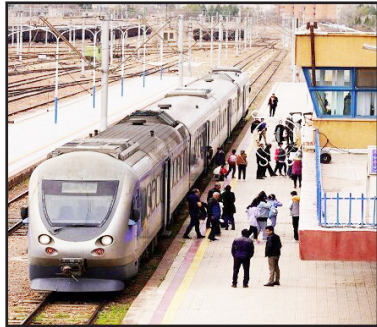
طرح نو؛ گروه شهری

مدیرکل راه‌آهن منطقه آذربایجان از ازسرگیری حرکت قطارهای تبریز-تهران و تبریز-مشهد پس از بازسازی بخش‌های آسیب‌دیده مسیر خبر داد و گفت: این قطارها پس از وقفه‌ای حدود چهار تا پنج روزه دوباره وارد مدار بهره‌برداری شدند.