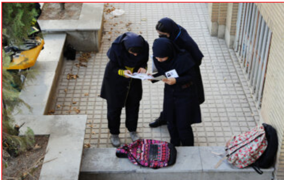
وی با بیان اینکه آمار شهدای دانش آموز استان در جنگ تحمیلی رمضان به سه نفر رسیده که همه آنها دختر و در فضای خارج از مدرسه به شهادت رسیدند، افزود: علاوه بر این سه شهید، حدود ۱۰ دانش‌آموز نیز در جریان حملات اخیر دچار مصدومیت شده‌اند که با نحوه برگزاری آن مشخص نیست.

طبق آخرین آمار موجود به ترتیب ۶۳۶ واحد آموزشی، ۴۲ فضای اداری و ۴۵ فضای فرهنگی و ورزشی در کشور آسیب دیدند. / ایرنا