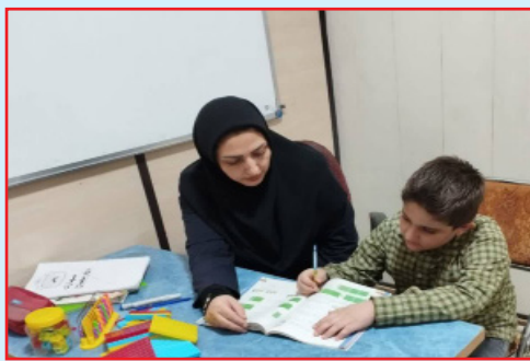
مسیر آموزش است.

در شهرستان سلماس نیز آموزگار پرتلاش دبستان علم و ادب، با باور به این‌که آموزش نباید در هیچ شرایطی متوقف شود، فضایی ساده اما سرشار از امید برای ادامه یادگیری دانش‌آموزان فراهم کرده است. او با همت و دغدغه‌مندی، کلاس درس را در خانه خود برپا کرده تا چراغ دانایی همچنان روشن بماند.