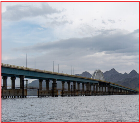
میدانی مستمر و هماهنگی دقیق بین دستگاهی است.

وی با تأکید بر اهمیت افزایش وسعت دریاچه ناشی از بارش‌های اخیر، افزود: توسعه سامانه‌های پایش زیست‌محیطی، تأمین تجهیزات نوین برای یگان حفاظت، و بهبود مسیرهای دسترسی به جزایر حساس در دستور کار اداره‌کل قرار دارد. تلاش خواهیم کرد با بهره‌گیری از ظرفیت‌های ملی و استانی، از این فرصت ارزشمند برای ارتقای سطح حفاظت و احیای کامل این پارک استفاده کنیم.