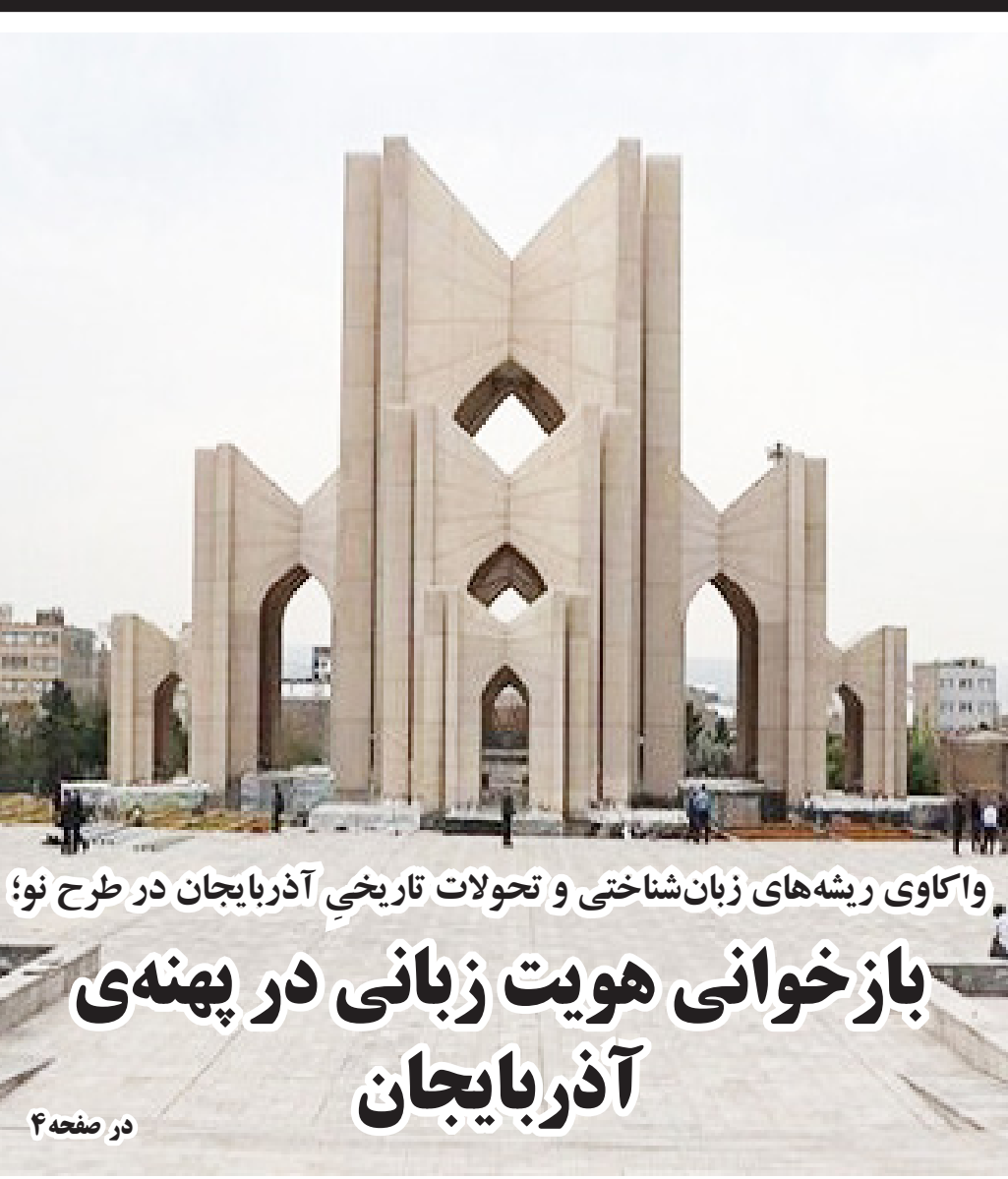
واکاوی ریشه‌های زبان‌شناختی و تحولات تاریخی آذربایجان در طرح نو؛