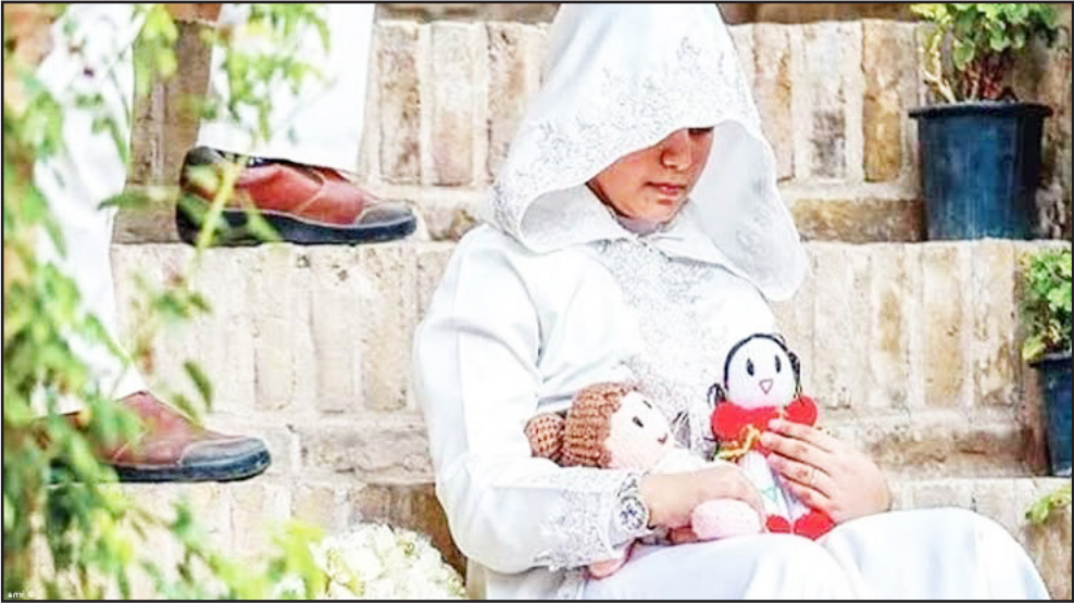
صدور مجوزهای ازدواج زیر سن قانونی.