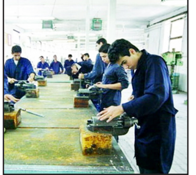
طرح نو؛ گروه خبر

مدیرکل آموزش فنی و حرفه‌ای آذربایجان شرقی از استفاده از ظرفیت مهارت آموزان آذربایجان شرقی در بازسازی و آبادانی مناطق آسیب‌دیده از جنگ خبر داد و گفت: سازمان آموزش فنی و حرفه‌ای کشور با هدف آماده‌سازی نیروی انسانی ماهر برای مشارکت مؤثر در بازسازی و آبادانی کشور در دوران پساجنگ، پویش‌هایی را با رویکردی جهادی و مهارت‌محور راه‌اندازی کرده است.