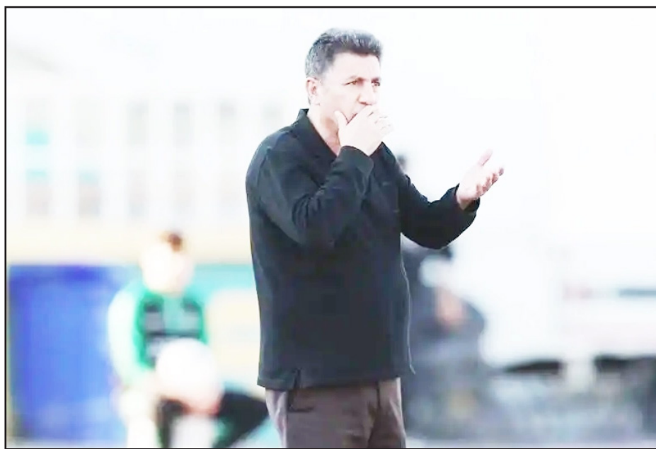
حالا تازه‌ترین موضع‌گیری امیر قلعه‌نویی نشان می‌دهد که او بی‌توجه به گمانه‌زنی، امید به حضور تیم ملی در جام جهانی دارد و برنامه‌هایش را در این راستا تنظیم کرده است.

مسئولان ارشد وزارت ورزش و جوانان و فدراسیون فوتبال منتظر آن هستند که مجوز حضور و یا عدم حضور در جام جهانی ۲۰۲۶ از سوی «شعاع» صادر شود. در شرایطی که در روزهای گذشته با موضع‌گیری مثبت سخنگوی دولت، احتمال صدور مجوز حضور تیم ملی افزایش پیدا کرده و از سوی دیگر، جانی ایفانتینو، رئیس فیفا هم حضور ایران در جام جهانی را قطعی دانسته،