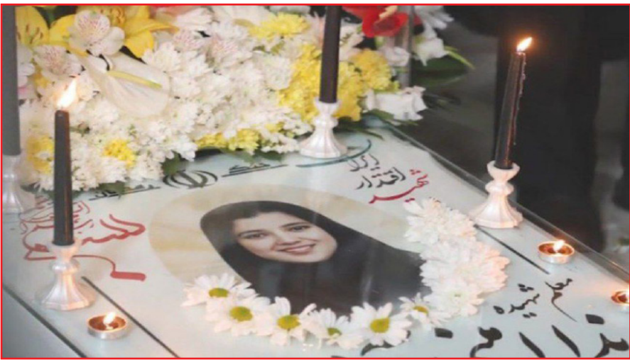
شهید گاه و بی گاه ابری و بارانی می شود و در فراق آن ها می بارد و می گرید.