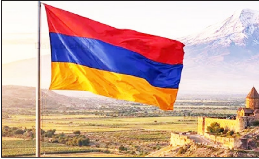
غرب، «فلج اقتصادی» خواهد بود.

دولت نیکول پاشینیان با میزبانی از این نشست، عملاً عبور از وابستگی مطلق به مسکو را فریاد زده است. برای ارمنستان، این حرکت یک قمار استراتژیک برای بقاست. پس از شکست‌های پیاپی در مناقشات قره‌باغ و احساس بی‌وزنی در پیمان امنیت جمعی، ایروان به این نتیجه رسیده که «امنیت روسی» دیگر تضمین‌کننده تمامیت ارضی‌اش نیست. اما این چرخش به غرب، با واکنش تند ولادیمیر پوتین مواجه شده است. تهدید به تحریم‌های اقتصادی و قطع جریان انرژی، نخستین تیرهایی است که از چله کمان روسیه رها شده است. روسیه به‌خوبی می‌داند که ارمنستان به لحاظ اقتصادی همچنان به بازارهای اوراسیا و گاز روسیه وابسته است و فشار بر این نقاط ضعف می‌تواند ایروان را با بحران داخلی مواجه کند.