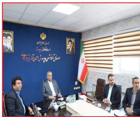
ساماندهی نیروی انسانی، ثبت نام دانش آموزان، توزیع کتب درسی، بهسازی و تجهیز فضاهای آموزشی، و

ترم، بررسی روند آماده سازی مدارس برای آغاز سال تحصیلی جدید و موضوعات مختلف دیگر برگزار شد. علیرضا کاظمی وزیر آموزش و پرورش با ارزیابی عملکرد استان ها در اجرای برنامه های پروژه مهر، از آذربایجان غربی به دلیل برنامه ریزی منسجم، پیگیری مستمر و هماهنگی مطلوب میان بخش های مختلف آموزش و پرورش استان تقدیر کرد و این استان را در جمع برترین های کشور قرار داد. علی اکبر صمیمی مدیرکل آموزش و پرورش آذربایجان غربی گفت: پروژه مهر به عنوان یکی از مهم ترین برنامه های سالانه وزارت آموزش و پرورش، با محوریت آماده سازی مدارس در حوزه های