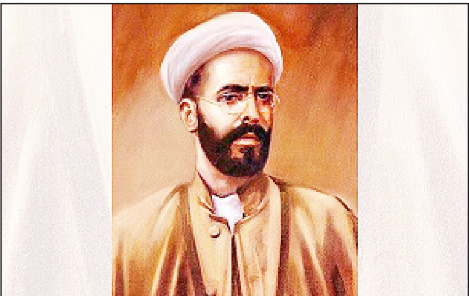
یک مسئولیت اخلاقی و دینی می‌دانست.