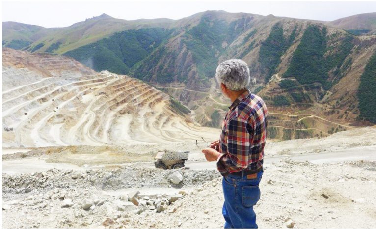
واحدهای تولیدی کاهش یابد.