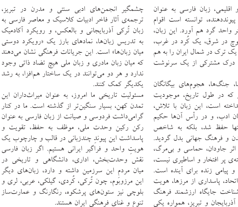
طرح نو؛ سردبیر ایران‌زمین در درازنای تاریخ پرفرازونشیب خود، همواره همچون فرشی هزاررنگ بوده است که تاروپود آن از تنوع فرهنگی و پندهای محکم آن از وحدت ملی بافته شده است. در میان تمام مناطق این مرزوبوم، آذربایجان شرقی و به‌ویژه کهن‌شهر تبریز قهرمان، جایگاهی منحصربه‌فرد و راهبردی در قوام‌بخشی به هویت ایرانی داشته است. این دیار مهد تمدن، مشعل‌دار پیشرفت‌های علمی، فرهنگی و ادبی ایران بوده و پناهگاهی امن برای آزادی‌خواهان و خردورزان در تمام اعصار به شمار رفته است. آذربایجان گرچه خطه‌ای است که مردمان سلحشور و وفادارش به زبان شیرین و آهنگین ترکی آذربایجانی سخن می‌گویند، اما در طول تاریخ، همواره خود را پاسدار و دیده‌بان بیادار زبان، ادب و فرهنگ فارسی دانسته است. این پیوند وثیق و ناگسستی، نشانه‌ای آشکار از همگرایی ریشه‌های عمیق فرهنگی در پهنه جغرافیایی ایران دارد؛ جایی که تفاوت‌های زبانی نه تنها عاملی برای جدایی نبوده‌اند، بلکه به عنوان ثروتی ملی، پایه‌های وحدت سرزمینی ما را استوارتر کرده‌اند.

نگاهی به شناسنامه ادبی ایران نشان می‌دهد که آذربایجان چگونه در آغوش خود، ستارگان درخشانی را پرورش داده که هر یک در آسمان فرهنگ و ادب این مرزوبوم جاودانه شده‌اند. چهره‌های بزرگی چون قطران تبریزی، اوحدی مراغه‌ای و در دوران معاصر، صائب تبریزی و شهریار بزرگ، نمونه‌های بارز این پیوند ارگانیک هستند. حکیم قطران تبریزی در قرن پنجم هجری، نخستین دیوان شعر به زبان فارسی دری را در این خطه پدید آورد تا نشان دهد آذربایجان از آغاز، سهمی بنیادین در