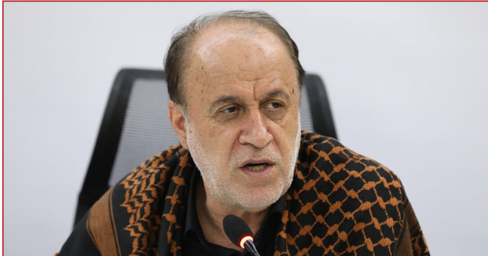
طرح نو؛ گروه خبر

دولت در زمان آغاز این طرح اعلام کرد منابع مالی لازم برای اجرای آن در یک دوره چهارماهه، از دی تا پایان فروردین سال جاری، تأمین شده و هدف از اجرای این سیاست را افزایش قدرت خرید خانوارها در تأمین اقلام اساسی و هدایت پاره‌ها به سمت کالاهای ضروری دانسته بود.