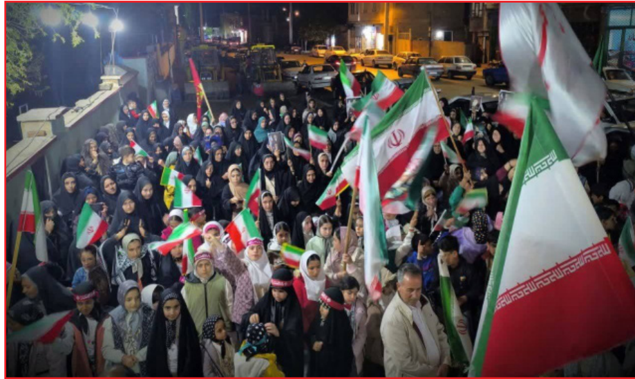
دانست و ادامه داد: این رسانه‌ها از جمله اینترنت‌نشان رسانه‌های شیطانی هستند.

امام جمعه ارومیه همچنین با گرامیداشت ۲۶ اردیبهشت روز بزرگداشت شهدای وزارت دفاع و گرامیداشت یاد وزیر شهید، امیر نصیرزاده اظهار کرد: این شهید والامقام در محضر امام شهید به شهادت رسید و پیش از آن نیز همه وجودش را وقف دفاع از کیان اسلامی کرده بود. حجت الاسلام والمسلمین قریشی با تأکید بر ترویج روزافزون فرهنگ ایثار و شهادت در جامعه گفت: تا زمانی که این فرهنگ وجود دارد، هیچ زیاده خواهی نخواهد توانست به کشور ما تعرضی کند. وی افزود: این حضور پرشور مردم در خیابان طی بیش از دو و نیم ماه گذشته نیز در سایه فرهنگ شهادت است. نماینده ولی فقیه در آذربایجان غربی با بیان اینکه ملت عزیز ایران با عنایت و اراده الهی پیروز است، اضافه کرد: طبق فرموده امام شهید خداوند پیروزی ملت ایران را تضمین کرده است