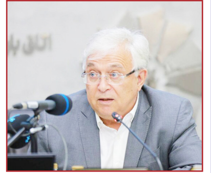
طرح نو؛ سردبیر

تا روند تأمین مواد اولیه از مرزها تسریع یابد. رئیس اتاق بازرگانی تبریز به پتانسیل‌های ترانزیتی منطقه اشاره کرد و گفت: منطقه‌ی آزاد ماکو ظرفیت پذیرش ۱۰ هزار کامیون را ندارد و در این زمینه می‌توان از ظرفیت بالقوه‌ی منطقه آزاد سهلان و منطقه‌ی آزاد ار بهره‌مند شد.