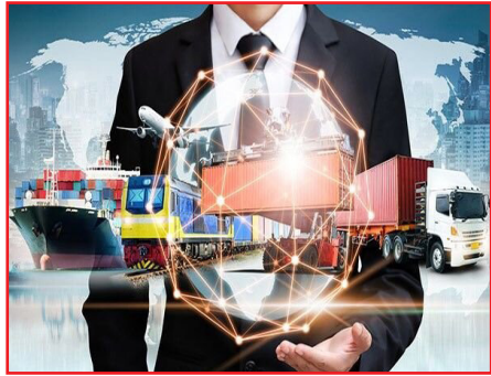
اشتغال مستقیم و غیرمستقیم برای هزاران نفر، افزایش درآمدزایی از محل ترانزیت و تقویت اقتصاد کشور و استان در شرایط کنونی می شود.

وی همچنین با تأکید بر ظرفیت های گردشگری این تالاب خاطر نشان کرد: چمن متحرک چملی با چشم اندازهای طبیعی منحصر به فرد، پوشش گیاهی خاص و شرایط زیست محیطی ویژه، می تواند به یکی از قطب های مهم گردشگری طبیعی و اکوتوریسم در استان تبدیل شود؛ به شرط آنکه توسعه گردشگری در این منطقه با رویکردی مسئولانه، همراه با حفاظت و مدیریت اصولی انجام شود. رئیس اداره محیط زیست تکاب با تأکید بر لزوم همکاری همگانی برای حراست از این میراث طبیعی خاطر نشان کرد: حفظ «چملی» مستلزم رعایت ضوابط زیست محیطی از سوی گردشگران است. از بازدیدکنندگان انتظار می رود با پرهیز از آسیب رسانی به پوشش گیاهی و مدیریت پسماندها، در پاسداشت این اثر ملی مشارکت کنند تا نسل های آینده نیز بتوانند از این موهبت کم نظیر بهره مند شوند.