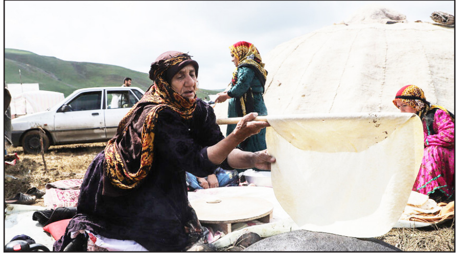
طرح نو؛ گروه گزارش در میان دشت هارنا و زیر باران رحمت الهی، جشنواره فرهنگی ورزشی عشایر ارسباران، رویدادی فراتر از یک مسابقه اسب‌دوانی با روایت اصالت فرهنگی، همبستگی ملی و پایداری عشایر قره‌داغ برگزار شد.