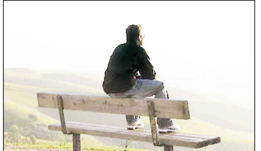
وقتی بی‌حوصلگی فراتر از یک حال بد موقت است

چگونه می‌توان از یک حال بد عبور کرد؟ متخصصان سلامت روان معتقدند برخی راهکارهای ساده می‌تواند به کاهش شدت بدخلقی و مدیریت بهتر احساسات کمک کند. یکی از این توصیه‌ها، تمرکز بر چیزهایی است که فرد بابت آن‌ها احساس قدردانی دارد. یادآوری افرادی که در زندگی حامی انسان هستند یا توجه به اتفاقات مثبت، می‌تواند جریان فکری منفی را تا حدی متوقف کند.