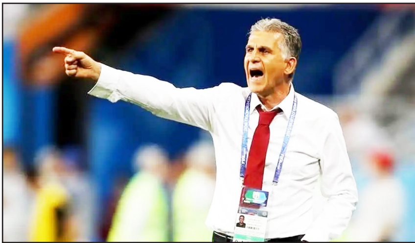
ملی به جام‌های جهانی ۲۰۱۴ و ۲۰۱۸ صعود کرد و در جام جهانی ۲۰۲۲ در شرایطی روی نیمکت به این مسابقات صعود کرد و کی‌روش تنها ۲ ماه نشست که تیم ملی با مربیگری دراکان اسکوچیچ

طرح‌نو؛ گروه ورزش کارلوس کی‌روش، با اختلاف رکورددار بیشترین سر مربیگری در تیم ملی در تاریخ جام جهانی است. پس از ۶ دوره حضور در جام جهانی، تیم ملی ایران دیگر تیم کم‌سابقه‌ای در تاریخ این رقابت‌ها به شمار نمی‌رود. در آستانه هفتمین حضور در جام جهانی، در سلسله گزارش‌هایی، رکوردداران ایران در تاریخ این مسابقات معرفی شده است. در ششمین قسمت از این مطالب، رکوردداران بیشترین مربیگری در جام جهانی مرور شده است.