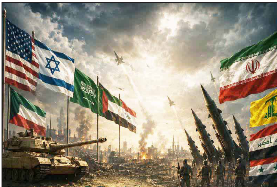
طرح نو؛ گروه سیاست

پاسخ قاطع ایران به هرگونه شیطنت دشمنان به خوبی آشکار می‌سازد که دکترین «بزن و دررو» برای همیشه در تاریخ مدفون شد و جای خود را به دکترین «یکی بزنی، ده تا می‌خوری» داد.