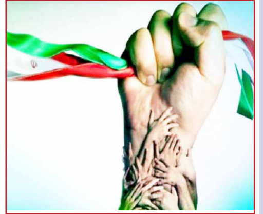
طرح نو؛ سردبیر

ایران، سرزمینی است که همواره بر سر چهارراه تاریخ و تمدن‌ها ایستاده است؛ سرزمینی با تنوعی بی‌نظیر از اقوام، زبان‌ها، آیین‌ها و فرهنگ‌ها. این تنوع، اگرچه گاه چالش‌برانگیز به نظر می‌رسد، اما در واقع سرمایه‌ای استراتژیک و تمدنی است که می‌تواند پیشوان توسعه، انسجام اجتماعی و اقتدار ملی باشد. وحدت ملی، نه به معنای حذف تفاوت‌ها، بلکه به معنای هم‌زیستی آگاهانه، احترام متقابل و درک مشترک از سرنوشت ملی است.