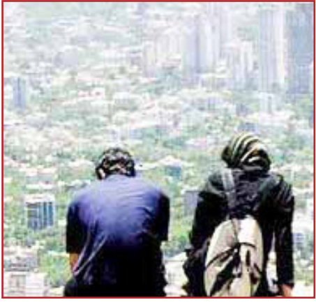
نیست؛ یک مسئولیت اقتصادی و اجتماعی ملی است و همه دستگاه‌ها باید در کنار جوانان بایستند.

دنبال می‌شود. وی عنوان کرد: بانک‌ها باید بدانند وام ازدواج حق جوانان است، نه یک امتیاز تشریفاتی. قابل قبول نیست منابع قرض‌الحسنه به جای جوانان، صرف تسهیلات درون‌سازمانی شود و زوج‌های جوان بیش از یک سال در انتظار بمانند. معاون امور جوانان وزارت ورزش و جوانان در پایان گفت: حمایت از خانواده، فقط یک تکلیف فرهنگی