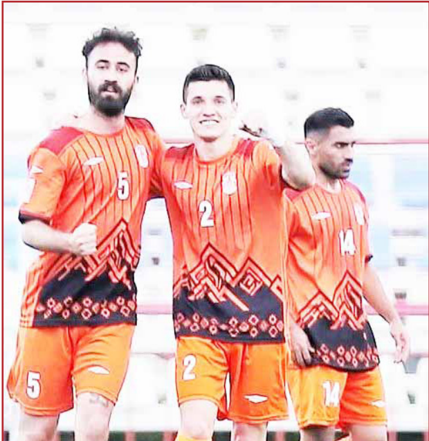
طرح‌نو؛ گروه ورزش

بیست‌وهفتمین هفته از رقابت‌های لیگ دسته اول فوتبال کشور با پیروزی شیرین و خانگی تیم کاراگستر شبستر آغاز شد. در نخستین دیدار هفته بیست‌وهفتم رقابت‌های لیگ دسته اول فوتبال کشور، تیم کاراگستر شبستر از ساعت ۱۶:۳۰ امروز (سه‌شنبه) در ورزشگاه قویلد تبریز به مصاف نیروی زمینی تهران رفت. نماینده فوتبال استان در این دیدار حساس موفق شد میهمان پایتخت‌نشین خود را با نتیجه یک بر صفر مغلوب کرده و سه امتیاز ارزشمند این مسابقه خانگی را به اندوخته‌های خود اضافه کند.